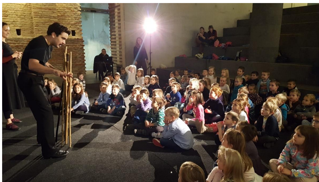
Táncról tánra ráhangoló a Magyar Nemzeti táncgyűttessel

http://www.mediaklikk.hu/video/hetvegi-belepo-2017-02-05-i-adas/