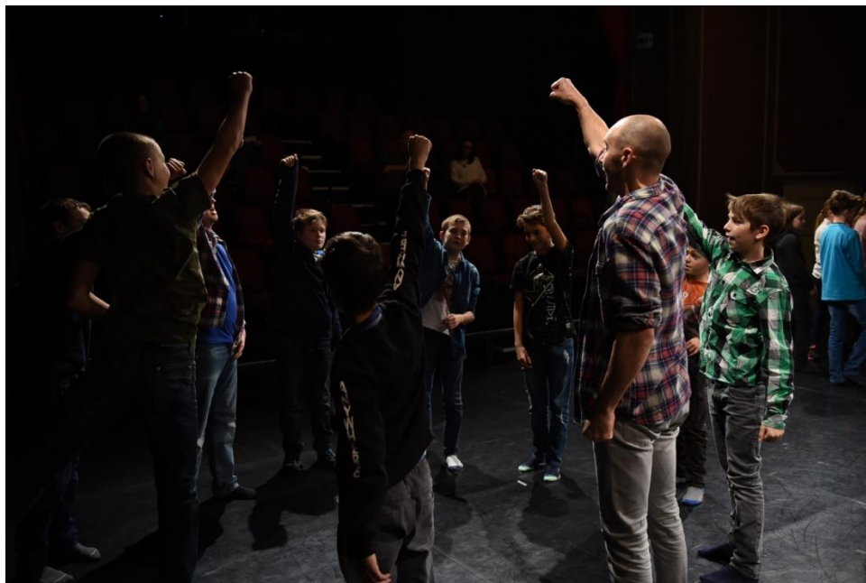
Igaz történet alapján komplex táncszínházi nevelési foglalkozás