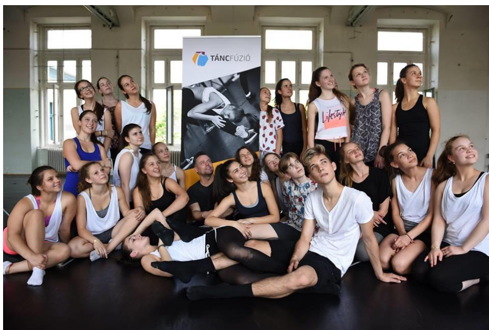
A 10. nyári Táncfúzió résztvevői