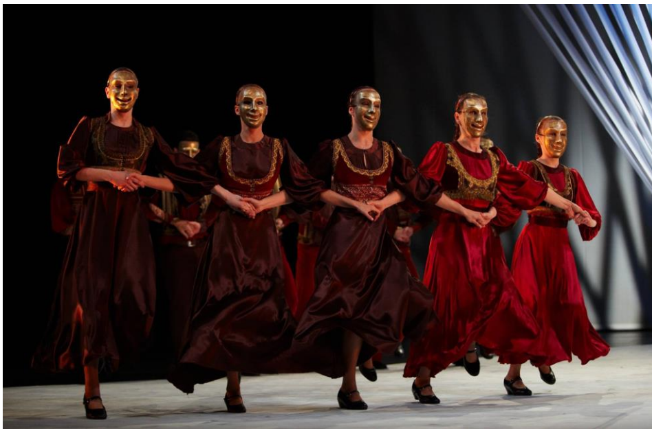
A Duna Művészegyüttes Örökkön-örökké című előadása