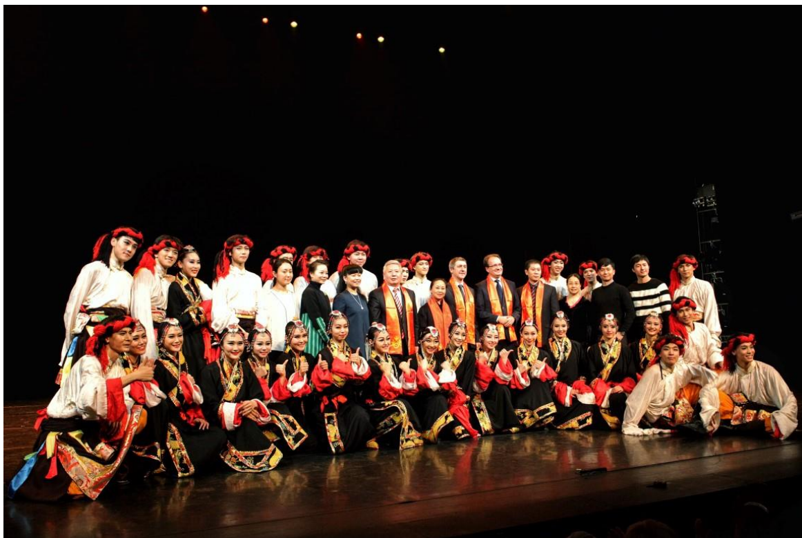
A Pekinger Táncakadémia táncsoportja az budapesti előadás utána a Müpa színpadán.