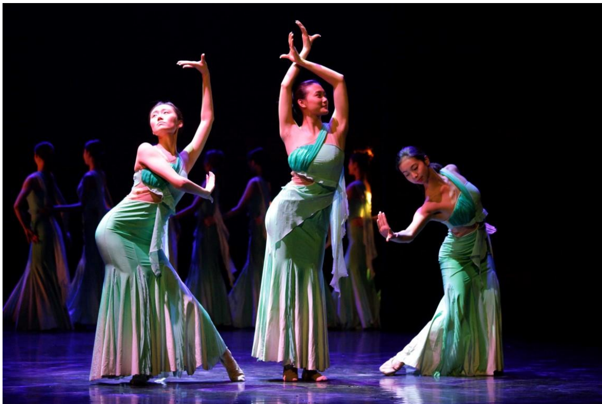
Beijing Dance Academy Kína néptánckincse című egzotikus kínai tánc showja a Müpában